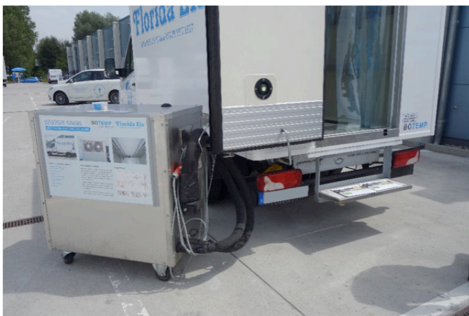
Stationäres Kälte ladegerät

Als Alternative zu den Kühlbalken kann auch eine Kältebatterie mit Kühltank bei der eutektischen Kühlung eingesetzt werden. Im Gegensatz zu den Kühlbalken ist die Kältebatterie thermisch isoliert und wird meistens unterhalb des Fahrzeugs angebracht. Ein Thermostat steuert die Kühlung, indem die gespeicherte Kälte über einen Wärmetauscher bedarfsgerecht an den Frachtraum abgegeben wird. Im Gegensatz zu den Kühlbalken kann die abgegebene Temperatur bei der Kältebatterie variiert werden. Der einstellbare Temperaturbereich liegt zwischen -25 und +5 °C.