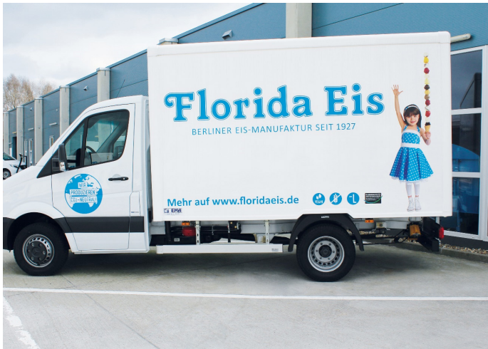
Kühlfahrzeug mit eutektischer Kühlung

Das Unternehmen Florida-Eis Manufaktur GmbH aus Berlin setzt die eutektische Kühlung bereits seit 2013 erfolgreich ein und war Praxispartner dieses Best-Practice-Tools. Seit 2017 wird die neueste Generation der eutektischen Kühlung in den Fahrzeugen mit den Kühlbalken und den stationären Kälteladegeräten eingesetzt.